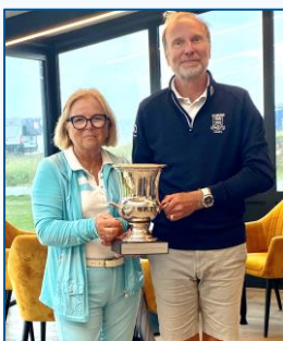
Marie remet la Coupe au capitaine de l'équipe de Rouen

Et à la fin ... l'équipe gagnante est Rouen Mont Saint Aignan, championne de Normandie par équipe seniors 1ere division en battant 3,5/1,5 Le Vaudreuil.